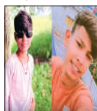
बच्चों की अर्थ सड़क पर रखकर किया प्रदर्शन

यहां शनिवार देर रात एक सड़क हादसा हो गया। बोलेरो ने एक ही बाइक पर सवार चार युवकों को टक्कर मार दी। हादसे में 13 और 16 साल के दो लड़कों की मौत हो गई, जबकि दो अन्य गंभीर रूप से घायल हो गए। टक्कर मारने वाली बोलेरो पर मग्न शासन लिखा हुआ था। घटना के बाद स्थानीय लोगों ने चालक को पकड़ लिया और पुलिस के हवाले कर दिया। कोतवाली थाना पुलिस ने मामला दर्ज कर जांच शुरू कर दी है। हादसा शुगर फैक्ट्री चौराहा से लुनिया चौराहे के बीच मोती बाबा मंदिर के पास रात करीब 11 बजे हुआ। बोलेरो चालक तेज शोष पेज 4 पर