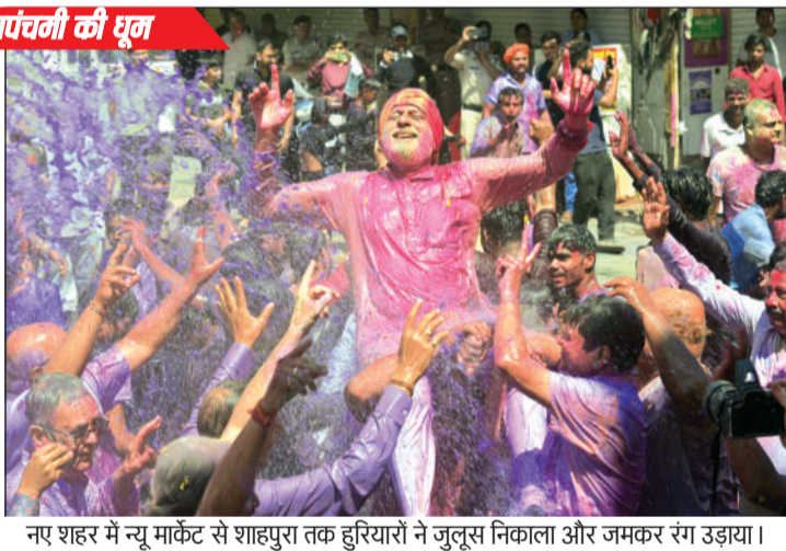
नए शहर में न्यू मार्केट से शाहपुरा तक हरियारों ने जुलूस निकाला और जमकर रंग उड़ाया।

पुराने शहर के सराफा चौक पर सुबह-सुबह ही रंगपंचमी का असर दिखाई देने लगा था। जैसे ही 10 बजे लोगों की भीड़ जुटने लगी। देखते-देखते ही सड़कों की सड़िया में लोग जमा हो गए। 12 बजते ही ढोल-ढमाके, डीजे और रंग-गुलाल के साथ श्री हिंदू उत्सव समिति के चल समारोह की शुरुआत सुभाष चौक से की गई। यहां डीजे पर फाग गीत के साथ लोग जहां एक-दूसरे को होली के रंग में रंग रहे थे, वहीं छतों से हरियारों पर रंग-पानी बौछार के रूप में उड़ाने जा रहा था। इसी बौछार का आनंद लेते हुए युवाओं की टोली जहां उत्साह में सराबोर दिखी, वहीं बड़े-बुजुर्गों ने भी अपने-अपनों को गुलाल-अबीर लगाया। 129 साल पुरानी परंपरा के तहत चल समारोह में झांकियां, डीजे, ध्वज, घोड़े-उंट भी शामिल रहे। हरियारों की टोलियां एक-दूसरे को रंग-गुलाल लगाते और नाचते-गाते निकलीं। मुख्य और बड़ा आयोजन चौक बाजार पर हुआ। इस बार यह 70वां आयोजन है। हरियारों भूत-पिशाच बनकर चल समारोह में शामिल हुए। सोमवारा में चल समारोह के पहलूते ही टैंकरों से रंग बरसाया गया। हिंदू उत्सव समिति की ओर से रंगपंचमी पर अरघ्य और बड़ा आयोजन हुआ, जिसमें लोगों ने उत्साह के साथ के भाग लिया। पुलिस की सुरक्षा में चल समारोह संपन्न हुआ तो वहीं नया भोपाल त्योहार उत्सव समिति के तत्वावधान में धूमधाम से रंगपंचमी चल समारोह निकला गया।