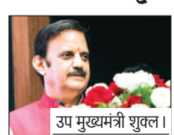
उप मुख्यमंत्री शुक्ल।

उप मुख्यमंत्री राजेन्द्र शुक्ल ने संभागीय आयुष चिकित्सा कार्याशाला और वैज्ञानिक संगोष्ठी का शुभारंभ किया। इस अवसर पर उप मुख्यमंत्री ने कहा कि हमें स्वस्थ रहने के लिए आयुर्वेद चिकित्सा पद्धति और प्राकृतिक खेती को अपनाना होगा। हमारी वर्तमान समय की तेज और अत्यवस्थित जीवनशैली के कारण शारीर कई स्वास्थ्य से जुड़ी समस्याओं से जूझ रहा है। एलोपैथी चिकित्सा से हमें