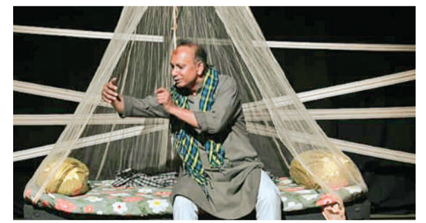
नाटक 'पढ़िए कलमा' का मंचन करते कलाकार।