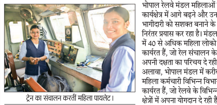
ट्रेन का संचालन करती महिला पायलट।