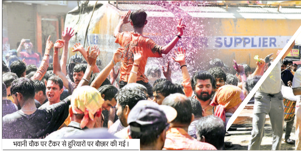
भवानी चौक पर टैंकर से हरियारों पर बौछार की गई।