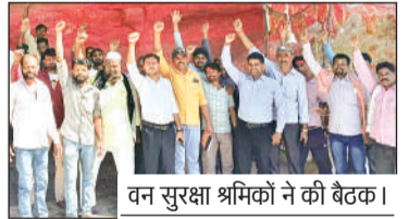
वन सुरक्षा श्रमिकों ने की बैठक।