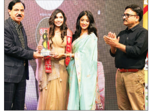
महिलाओं का सम्मान करते आयोजक।

अंतरराष्ट्रीय महिला दिवस के अवसर पर अवधपुरी स्थित एक होटल में रविवार को सम्मान समारोह आयोजित किया गया। कार्यक्रम का उद्देश्य समाज में उत्कृष्ट कार्य कर रही महिलाओं के योगदान को पहचान देना और उन्हें सम्मानित करना था। समारोह में भोपाल के विभिन्न क्षेत्रों में सक्रिय करीब 50 महिलाओं को सम्मानित किया गया।