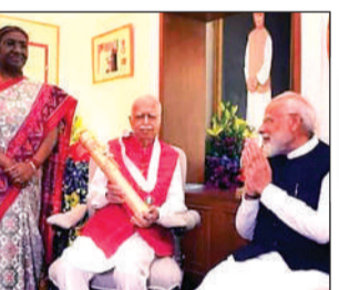
ममता ने आडवाणी की ये फोटो जारी कर राष्ट्रपति के अपमान का आरोप लगाया

ममता की सफाई न हमें बताया गया, न आयोजन में शामिल किया