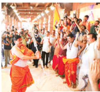
सीएम परंपरागत अंबाज में