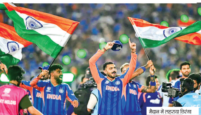
मैदान में लहराया तिरंगा

विजेता टीम को करीब 27.50 करोड़ और उपविजेता टीम को करीब 14.67 करोड़ रुपए मिले