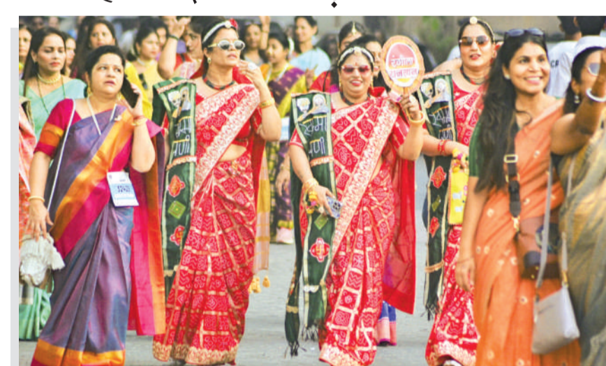
टाणे। अंतरराष्ट्रीय महिला दिवस के अवसर पर महाराष्ट्र के टाणे में रविवार को 'साड़ी वॉकथॉन 2026' में महिलाओं ने भाग लिया। प्रतिभागियों ने सशक्तिकरण और हथकरघा परंपराओं को बढ़ावा देने के लिए पारंपरिक साड़ियों में वॉक किया।