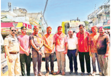
हरिभूमि न्यूज ॥ औबेदुल्लागंज

चल समारोह में बड़ी संख्या में शामिल हुए लोग, डीजे की धुनों पर युवाओं ने जमकर नृत्य किए