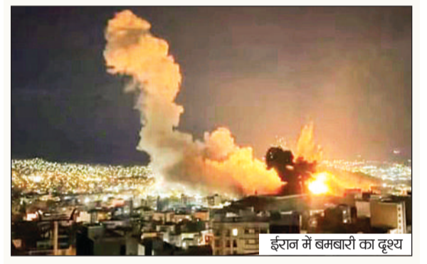
ईरान में छमबारी का दृश्य

पीएम के अनुसार राज्य सरकार ने इस आयोजन को पूरी तरह अव्यवस्था के हवाले कर दिया। यह घटना केवल राष्ट्रपति का अपमान नहीं है, बल्कि यह भारत के संविधान और उसकी मूल भावना का भी अनादर है। उन्होंने कहा कि लोकतंत्र की महान परंपरा में राष्ट्रपति का पद सर्वोच्च सम्मान का प्रतीक होता है। ऐसे में किसी भी राजनीतिक मतभेद से ऊपर उठकर इस पद की गरिमा बनाए रखना सभी की जिम्मेदारी है। पीएम मोदी ने टीएमसी सरकार पर सत्ता के अहंकार में डूबे होने का आरोप लगाते हुए कहा कि इस तरह