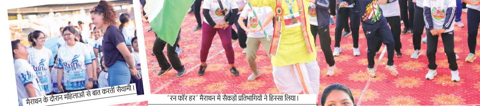
मैराथन के दौरान महिलाओं से बात करती सैयामी।