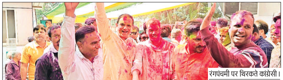
रंगपंचमी पर थिरकते कांग्रेसी।