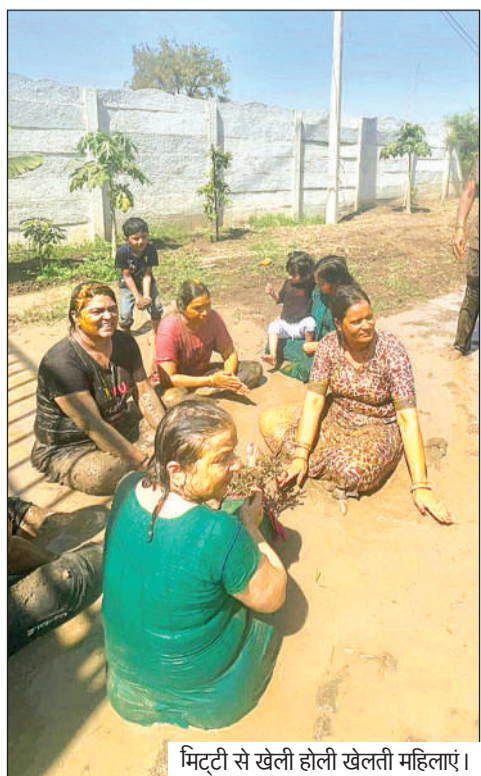
मिट्टी से खेली होली खेलती महिलाएं।

रंग पंचमी के इस अत्यंत आयोजन में अंतरराष्ट्रीय गुलाल मशीनों के माध्यम से आसमान को रंग-बिरंगे गुलाल से सराबोर हुआ, पूरे चल समारोह मार्ग पर पिचकारियों से रंगों की बौछार कर रंग पंचमी का उत्सव आनंद और उत्साह से मनाया।