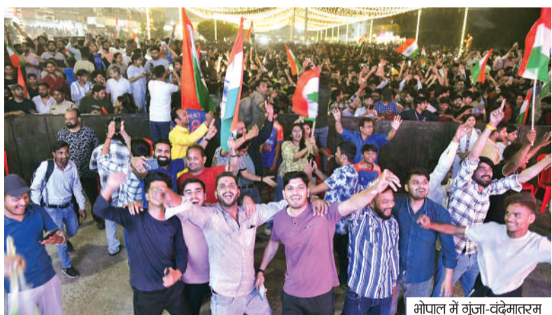
गोपाल में गूंजा-वदंमातरम

उज्जैन में रंगपंचमी के अलग ही रंग में नजर आए सीएम डॉ. यादव