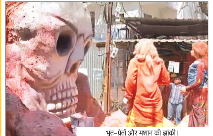
भूत-प्रेतों और मशान की झांकी।

भोपाल। राजधानी में एक बार फिर से होली की मस्ती छाई। रंगपंचमी के मौके पर रविवार को शहर एक बार फिर रंगों से सराबोर था। रंग-गुलाल, हड़दंग और पानी की बौछार में लोग जमकर झूमे। कोई एक-दूसरे को रंग रहा था, तो कोई गुलाल उड़ा रहा था। गली मोहल्ले और कॉलोनिजों में लोग रंग अबीर गुलाल में सराबोर थे। रंगपंचमी पर नए और शहर में रंगारंग समारोह भी निकले। लोगों में रंगपंचमी का उत्साह देखते ही बन रहा था तो वहीं चल समारोह में भी लोगों की भारी भीड़ उमड़ी।