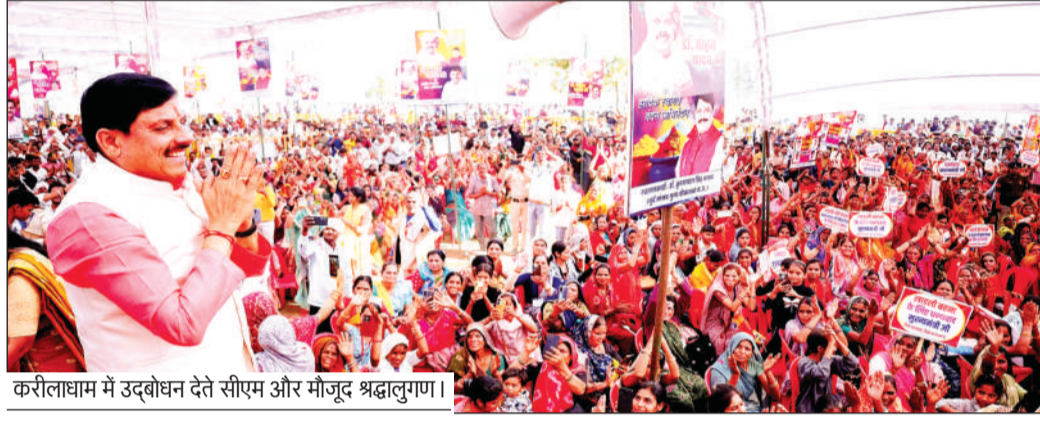
करीलाधाम में उद्बोधन देते सीएम और मौजूद श्रद्धालुगण।

मुख्यमंत्री ने करीला धाम पहुंचकर अशोकनगर जिले की 115.35 करोड़ के विकास कार्यों की सौगात