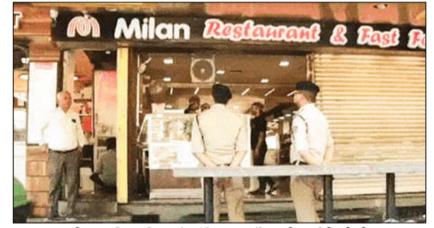
एमपी नगर स्थित मिलन रेस्टोरेंट पर सर्वे करती आईटी की टीम।