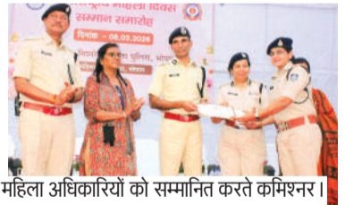
महिला अधिकारियों को सम्मानित करते कमिश्नर।