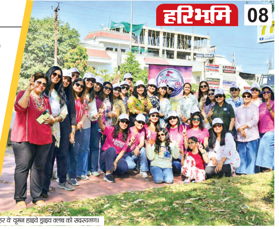
हर वे वूमन हाईवे ड्राइव क्लब की सदस्यगण।