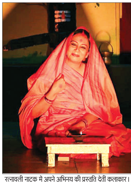
रत्नावली नाटक में अपने अभिनय की प्रस्तुति देती कलाकार।

श्रुति माधव महोत्सव के तीसरे और अंतिम दिन दो प्रभावशाली एकल प्रस्तुतियों का मंचन किया गया