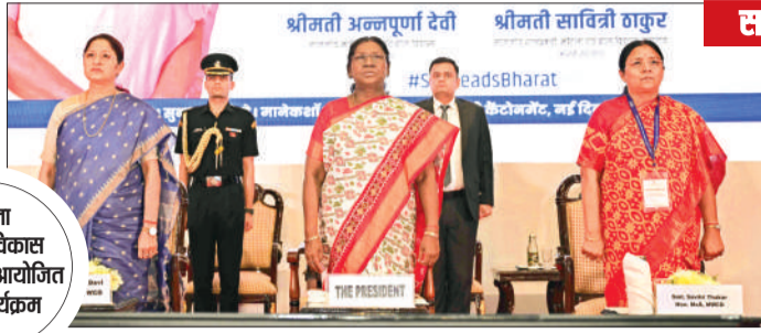
महिला एवं बाल विकास मंत्रालय ने आयोजित किया कार्यक्रम

अंतरराष्ट्रीय महिला दिवस के अवसर पर राष्ट्रपति द्रौपदी मुर्मू ने महिलाओं की शक्ति, उपलब्धियों और योगदान को सराहना की। उन्होंने कहा कि महिलाएं किसी से कम नहीं हैं और अगर उन्हें सही अवसर और समर्थन मिले तो वे हर क्षेत्र में बड़ी उपलब्धियां हासिल कर सकती हैं। रविवार को महिला एवं बाल विकास मंत्रालय की तरफ से आयोजित कार्यक्रम में राष्ट्रपति ने कहा कि अंतरराष्ट्रीय महिला दिवस सिर्फ महिलाओं की उपलब्धियों का सम्मान करने का दिन नहीं है, बल्कि यह उनके सशक्तिकरण के लिए देश की प्रतिबद्धता को दोहराने का भी अवसर है।