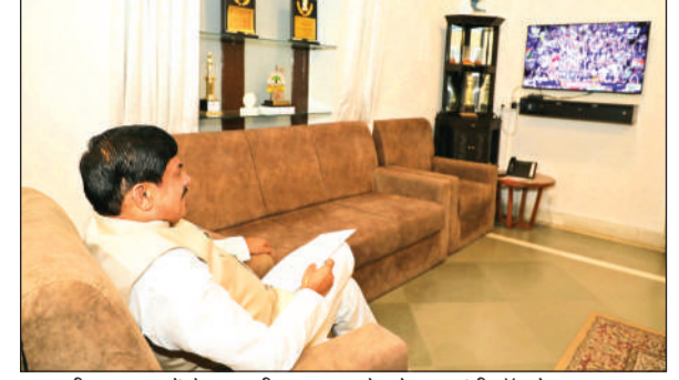
सीएम हाउस में मैच का सीधा प्रसारण देखते मुख्यमंत्री डॉ. मोहन यादव।

भारत वर्ल्ड कप का हकदार था, भारतीय क्रिकेटर सर्वश्रेष्ठ थे और सर्वश्रेष्ठ हैं : डॉ. यादव