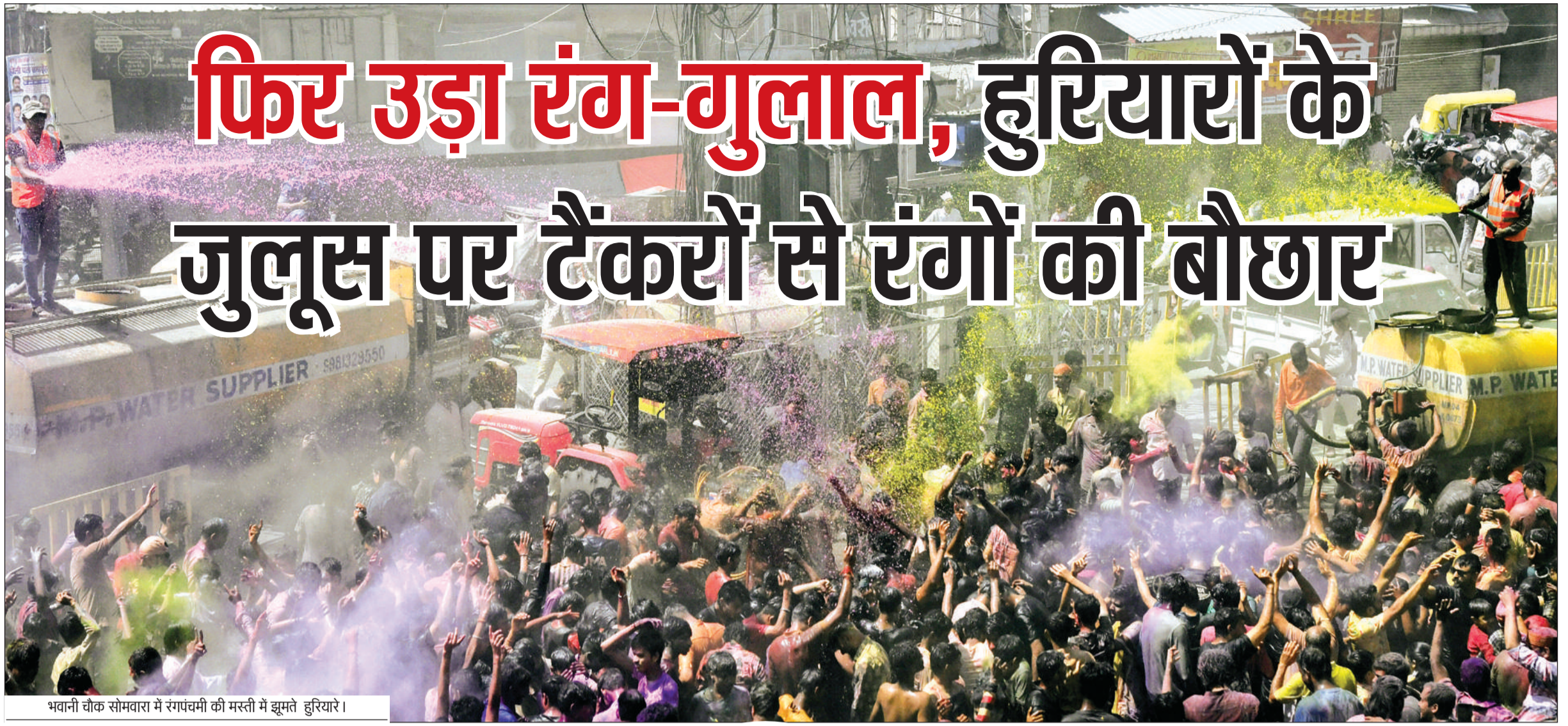
भवानी चौक सोमवारा में रंगपंचमी की मस्ती में झूमते हरियारों।