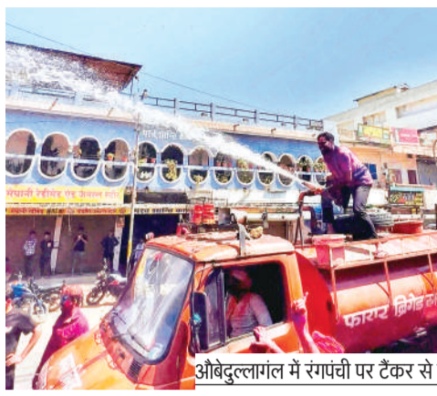
औबेदुल्लागंज में रंगपंचमी पर टैंकर से पानी की बोछार करते हुए। वहीं मस्ती में झूमते हुरियारों।

एक-दूसरे को रंग-गुलाल लगाकर रंगपंचमी की शुभकामनाएं दीं गले मिलकर आपसी भाईचारे और सद्भाव का संदेश