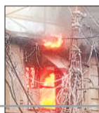
फायर ब्रिगेड की 10 गाड़ियां मौके पर पहुंची

कोतवाली थाना क्षेत्र में रविवार शाम करीब 4 बजे एक व्यापारी के घर में आग लग गई। आग लगते ही घर से तेज धुआं और लपटें उठने लगीं। उस समय घर के अंदर परिवार के 6 लोग मौजूद थे। इनमें से 5 लोगों को सुरक्षित बाहर निकाल लिया गया, जबकि जलने से बड़े की मौत हो गई। आग की सूचना मिलते ही दमकल और पुलिस की टीम मौके पर पहुंची। फायर ब्रिगेड कर्मियों ने रेस्क्यू ऑपरेशन शुरू किया। खिड़कियां तोड़कर घर के अंदर पहुंचे। इसके बाद अंदर फंसे लोगों को बाहर निकाला गया। टीम ने आग बुझाने के लिए अंदर से भी पानी का छिड़काव किया। घटना में व्यापारी परिवार की बहू शोष पेज 4 पर