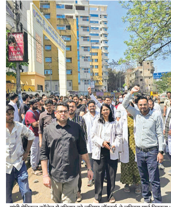
गांधी मेडिकल कॉलेज में रविवार को जूनियर डॉक्टरों ने जस्टिस मार्च निकाला।

स्टाइपेंड संशोधन लागू नहीं होने से आक्रोशित राजधानी समेत प्रदेश भर के आठ हजार से ज्यादा जूनियर डॉक्टर सोमवार से हड़ताल पर रहेंगे। जूनियर डॉक्टरों की हड़ताल से हमीदिया अस्पताल समेत प्रदेश भर के मेडिकल कॉलेज में मरीजों को ओपीडी में इलाज नहीं मिलेगा। हड़ताल से रूटिन ऑपरेशन टलने के साथ मरीजों को सिर्फ इमरजेंसी में ही इलाज मिलेगा। रविवार को लंबित स्ट्राइक संशोधन लागू नहीं होने के विरोध में जूनियर डॉक्टरों ने रविवार को प्रदेशभर के अलग-अलग मेडिकल कॉलेजों में 'जस्टिस मार्च' निकाला। राजधानी भोपाल के गांधी मेडिकल कॉलेज में दोपहर करीब 12 बजे सभी रेजिडेंट डॉक्टर एडमिन ब्लॉक पर एकत्र हुए। इसके बाद पूरे कैम्पस और आसपास के इलाकों में रैली निकालकर नारेबाजी की गई। डॉक्टरों ने कहा कि यह मार्च शांतिपूर्ण तरीके से आयोजित किया गया और सरकार से जल्द मांगें पूरी करने का अनुरोध किया गया है, ताकि आंदोलन को आगे बढ़ाने की जरूरत न पड़े।