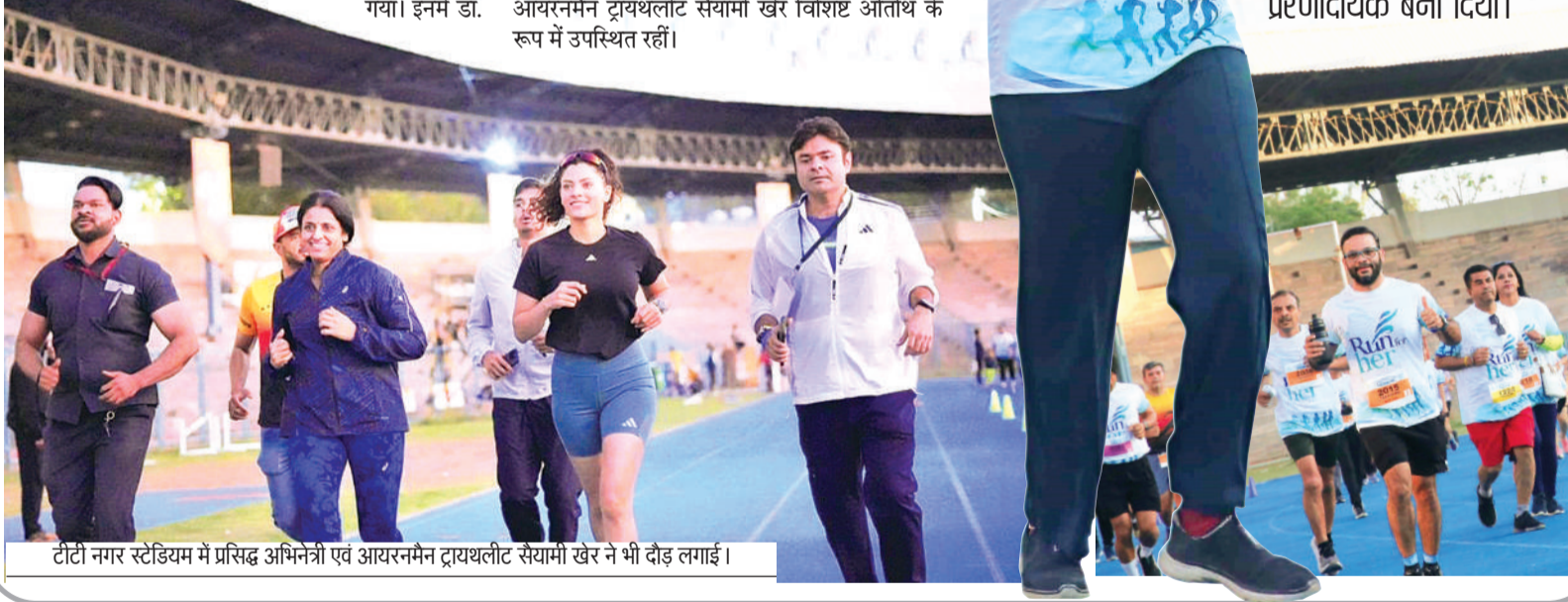
टीटी नगर स्टेडियम में प्रसिद्ध अभिनेत्री एवं आयरनमैन ट्रायथलीट सैयामी खेर ने भी दोड़ लगाई।

वहीं निदान, दिग्दर्शिका और अरुषि फाउंडेशन से आए लगभग 120 विशेष रूप से सक्षम बच्चों ने भी इस आयोजन में हिस्सा लेकर कार्यक्रम को और प्रेरणादायक बना दिया।