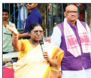
राष्ट्रपति मुर्मू ने शनिवार को सिलीगुड़ी में संबोधन के दौरान नाराजगी जताई थी

राष्ट्रपति के प्रोटोकॉल उल्लंघन को लेकर टीएमसी पर बरसे पीएम मोदी