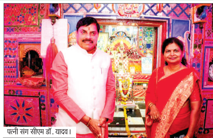
पत्नी संग सीएम डॉ. यादव।

धाम तीर्थ के विकास की कार्ययोजना बनाने के लिए निर्देश