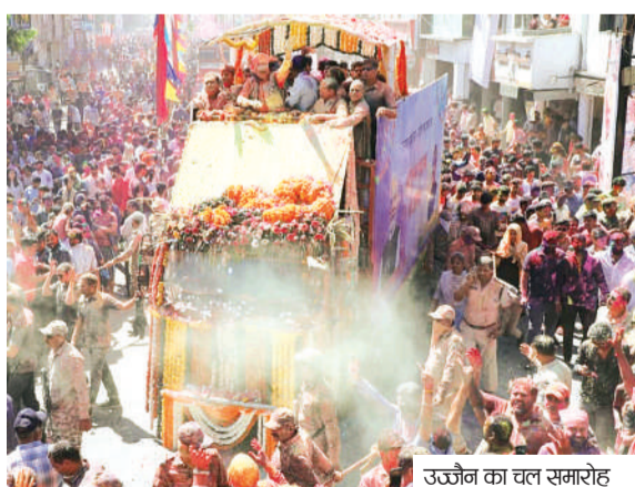
उज्जैन का चल समारोह

सीएम बोले परंपरागत ध्वज चल समारोह हमारे सांस्कृतिक गौरव का प्रतीक