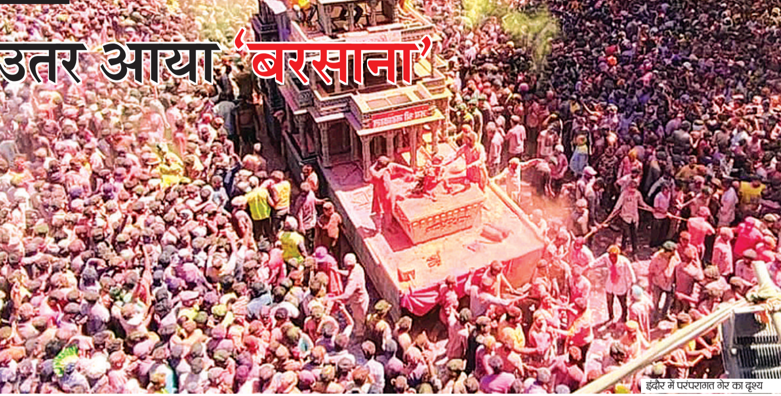
इंदौर में परंपरागत गेर का दृश्य

प्रदेश की आर्थिक राजधानी इंदौर में रंगपंचमी के मौके पर पारंपरिक गेर का सिलसिला सुबह से ही शुरू हो गया, जिसमें लाखों की संख्या में हरियारे राजबाड़ा और आसपास के इलाकों में उमड़ पड़े। गेर की शुरुआत टोरी कॉर्नर से हुई, जिसे पारंपरिक रूप से सबसे प्रमुख माना जाता है। यहां तीन विशेष टैंकरों पर मिसाइलनुमा उपकरण लगाए गए थे, जो हवा में सैकड़ों फीट ऊपर गुलाल का गुबार छोड़ रहे