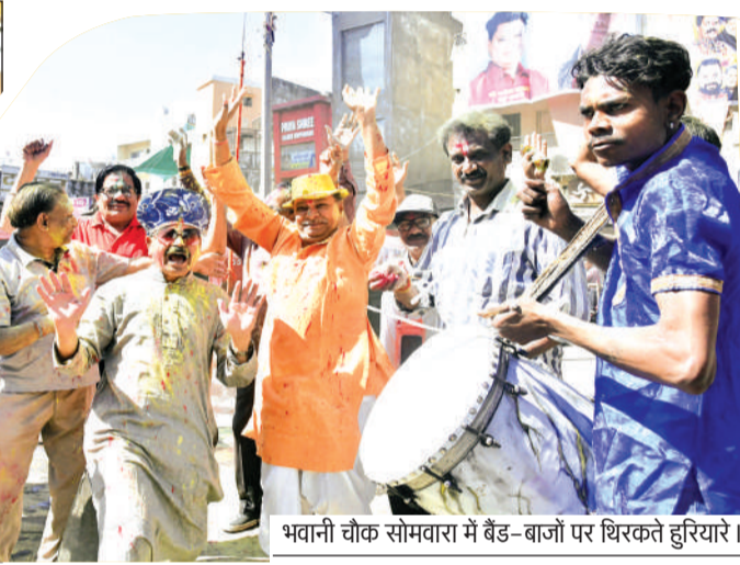
भवानी चौक सोमवारा में बैंड-बाजों पर थिरकते हरियारों।